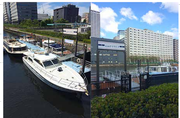
船着場「天王洲ヤマツピア」

※ご注意※ 東京モノレール 空港快速は天王洲アイランド駅には停まりませんので ご注意ください。