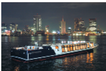
ZEA FLEETからの東京の夜景