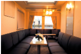
落ち着いた雰囲気のサロン